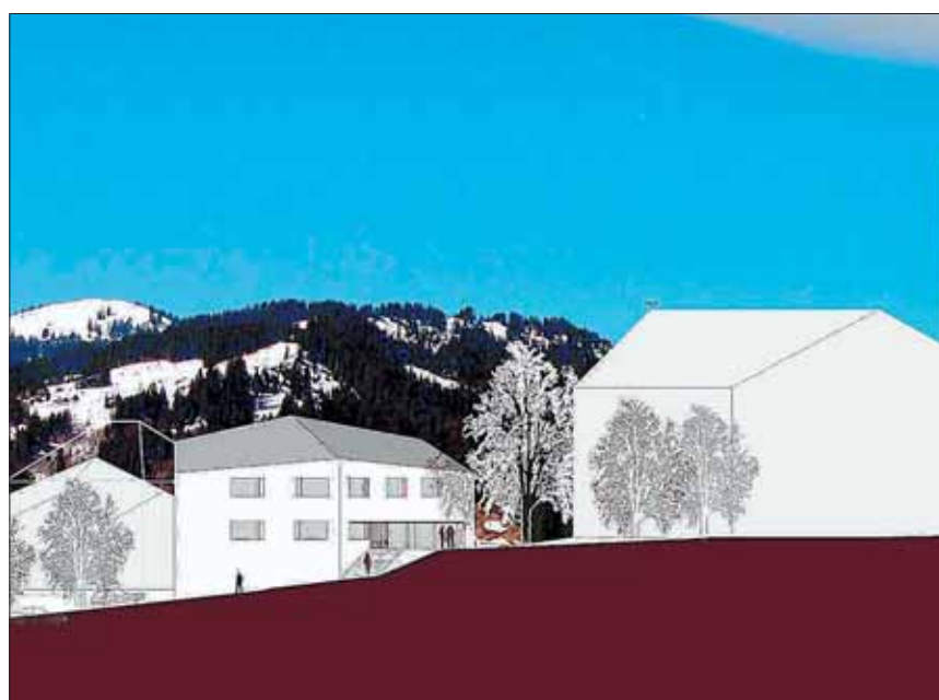
Das Computerbild der Architekten zeigt rechts die Umrisse der Pfarrkirche Oberiberg, in der Bildmitte das neue Gemeindehaus und links die Umrisse des alten Schulhauses vor dem möglichen Mehrfamilienhaus.

Jetzt will der Gemeinderat schnell vorwärts machen. Am kommenden 18. Mai lädt er zu einer Gemeindeversammlung ein. Sie hat nur ein Traktandum: den Projektierungskredit für das Gemeindehaus in der Höhe von 170 000 Franken. Die Urnenabstimmung findet am 18. Juni statt. Mit diesem Geld soll ein baureifes Projekt